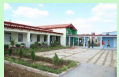
Centre Communautaire de formation artistique de KORIMAKAO