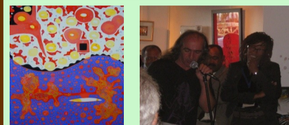
Photo du vernissage