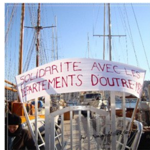
Rassemblement du 14 février 2009 Vieux Port, Marseille

Plusieurs manifestations, projections de film, rencontres/débats, sont venues affirmer le soutien du Collectif ASSO DOM PACA à la cause des régions de l'Outre-mer.