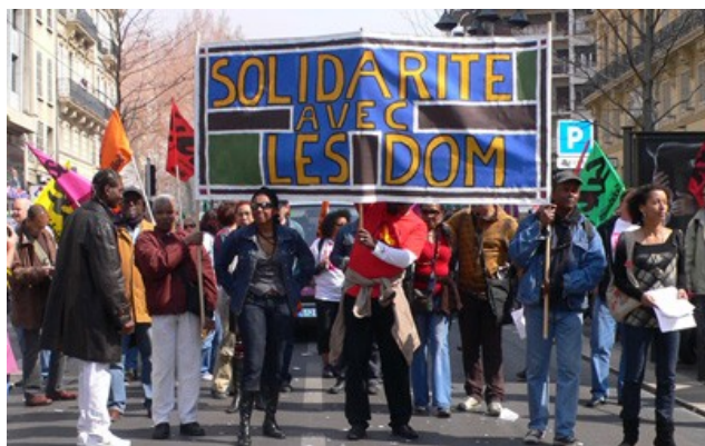
Rassemblement du 19 mars 2009, la Canebière, Marseille Banderolle réalisée pour le collectif par l'artiste plasticienne Françoise Sémiramoth

Aujourd'hui, le Collectif entend continuer de soutenir les revendications légitimes des travailleurs et du peuple des régions de l'Outre-mer, et contribuer à révéler les abus économiques et sociaux dont elles ont été et sont toujours victimes.