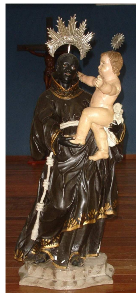
Anonyme, Saint Benedito , Eglise du Rosaire Collection D. Lahon

Mardi 5 mai 2009 - 20h A Cosmopolis (18, rue Scribe—Passage Graslin)